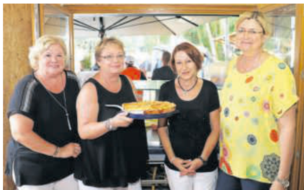
Ein fleißiges Helferteam kümmerte sich um die kulinarischen Bedürfnisse der Besucher.

se im Vorfeld für die Veranstaltung gebacken. Darüber hinaus gab es zahlreiche Spezialitäten vom Grill. Verkaufsstände, die den Bedarf von Pferd und Reiter abdecken, ergänzten die Angebote an den Veranstaltungstagen. So wurde trotz der etwas schwierigen Wetterlage ein stimmiges und anspruchsvolles Reitturnier auf die Beine gestellt, was auch im nächsten Jahr wieder großen Zuspruch über die Region hinaus finden dürfte.