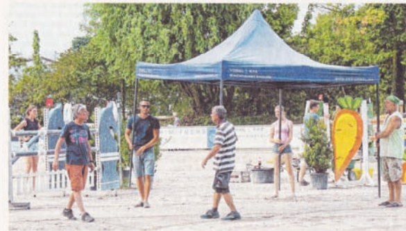
Viele Helfer des Reitervereins sind im Einsatz, um für ein tolles Turnier für Teilnehmer und Gäste zu sorgen.

Sonntag, 28. Juli: 9.30 Uhr Stil-springprüfung Kl. M*; 10.30 Uhr Stil-springprüfung Kl. M*; 12.30 Uhr Springprüfung Kl. S* letzte Chance (Artur-Damian-Gedächtnisspringen); 14.30 Uhr Pony-Führzügel-Wettbewerb mit Kostüm; 15 Uhr Springprüfung Kl. S mit Stechen** um den Großen Preis der Stadt Schwetzingen. oc