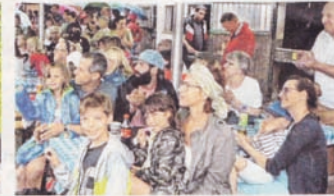
Das Publikum beim Reitturnier: Bestens versorgt feuert es die Akteure an.