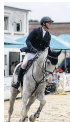
Beim Springen Klasse S** war Spitzen-Reitsport geboten.